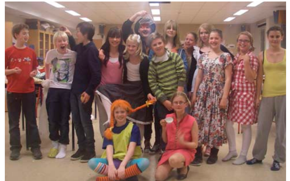
Comenius teatergång uppträdde kvällen då värdar och Comeniusbarn var inbjudna till Almåsskolan.