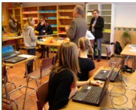
Invigning av matteverkstan