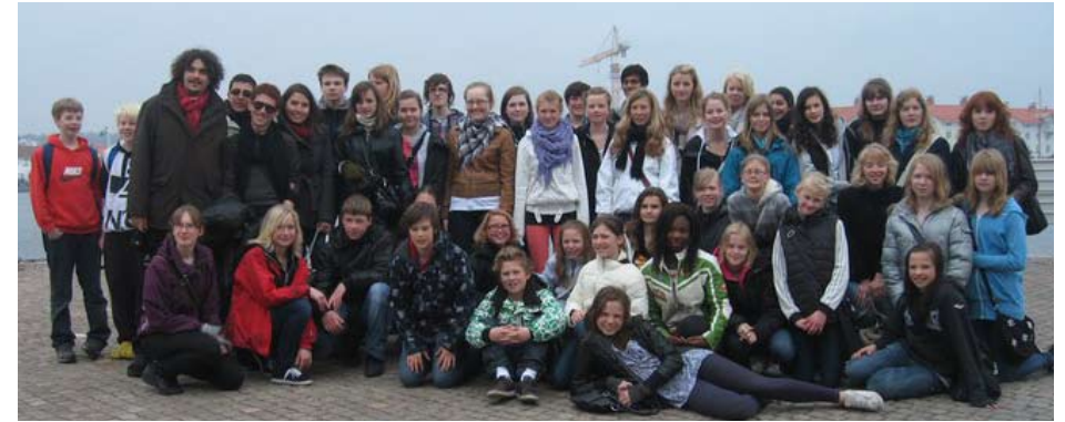
Våra europeiska gäster ihop med våra svenska Comenius barn

Vi åkte på flera intressanta utflykter bl.a. till ett utomhusmuseum med lämningar efter en antik romersk villa och